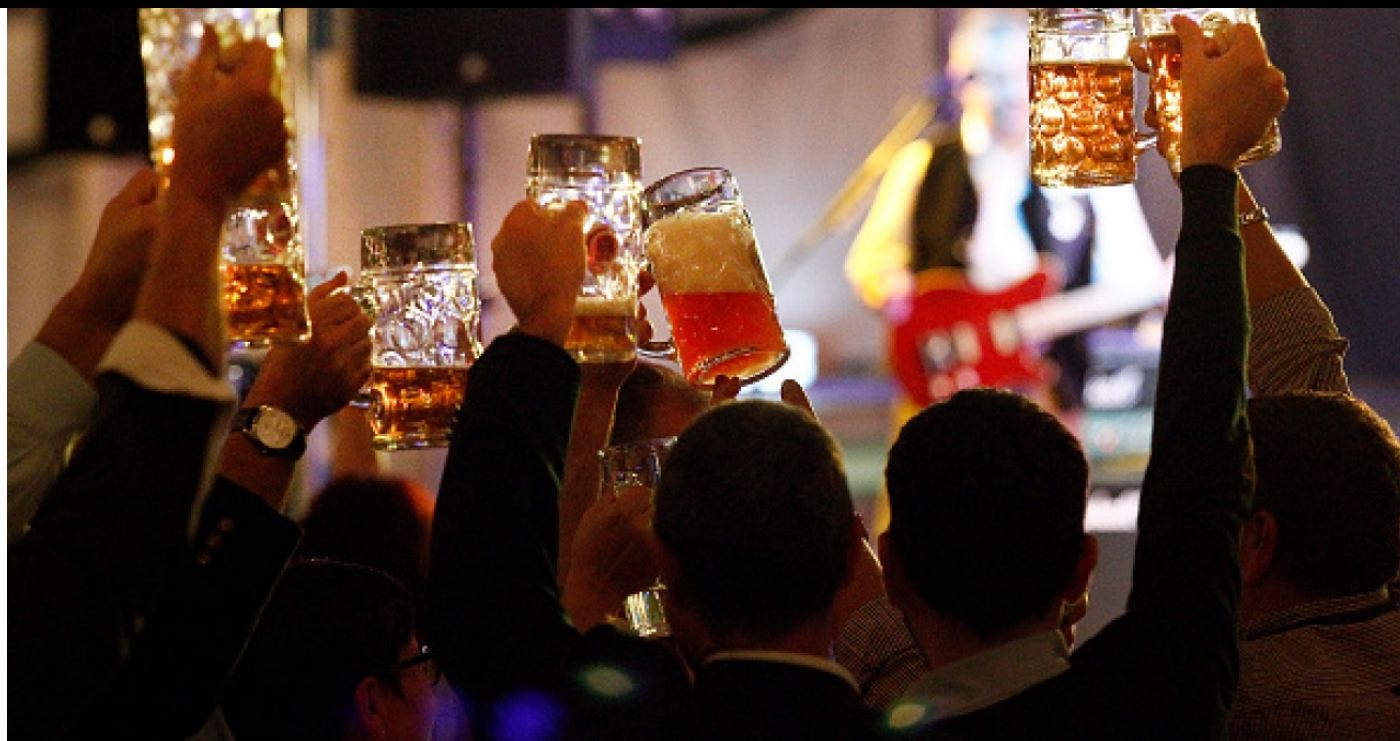
酒精往往為節慶活動的主角之一。