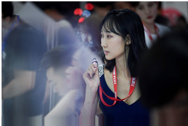
美國CDC指出，已有近200人因吸食電子煙生病。圖為2019年6月28日，一位售貨員在北京國際消費電子示範抽煙。

啟勵扶青會（啟勵）及國際青年學融基金會（Support!）早於本年中，共同舉辦一個青年非正式會議Tidal Wave Series，並邀請一群香港青年以輕鬆、不批判的態度，探討他們與朋輩之間使用電子煙的情況及看法。有關綜合意見可供美、港，以及各國政府參考，以瞭解時下年輕人對電子煙的看法。