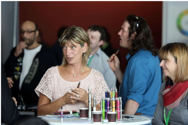
美國CDC在8月23日指出，已知有22個州合計有193宗可能由電子煙引起的嚴重肺病的潛在個案。其中22宗在伊利諾伊州。個案宗數在2天內急升，8月21日，CDC錄得16個州有153宗個案。圖為法國波爾多2014年3月13日的電子煙國際宣傳展。

要解答這些問題，我們首先要清楚知道，電子煙是一種透過蒸發液體，讓使用者直接吸入含有尼古丁，以及各種口味氣霧的電子產品。電子煙的熱力足以令液體霧化，並不像傳統香煙般，需要點燃煙草才能釋放煙霧。換言之，電子煙並不存有傳統香煙的致癌物及焦油。可是，長期吸食這些液體對我們的健康而言，卻依舊是一個謎，因為現今科學家尚未對電子煙作出長遠研究。