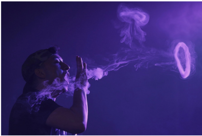
美國伊利諾州一名患者吸電子煙後肺部出現嚴重疾病，最後不治

再者，各國衛生部向來只談及傳統煙草對人類健康的禍害，卻甚少提及電子煙、加熱煙等新興產品。一眾參加者對執政者於欠缺全面資訊下，強行倡議全面禁售電子煙的成效抱持懷疑態度，他們憂慮，新例非但未能杜絕青年接觸電子煙，更有機會將之推往黑市。