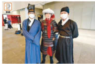
「古人」着漢服駕臨 故宮氛圍相映襯 要聞港聞