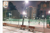
打網球暈倒 中年漢猝死 要聞港聞