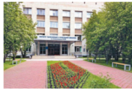
俄搜捕涉叛國科學家 增至兩人 兩岸國際